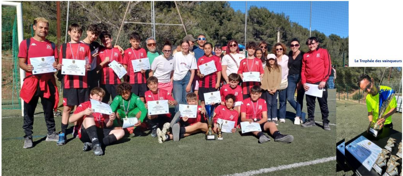
Le Trophée des vainqueurs

Vainqueurs de notre premier Trophée du Fair-Play U14