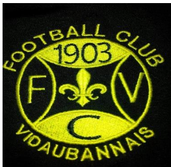
Francis JONCKIERE La légende de Vidauban